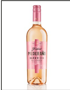
Freixenet Mederaño Glühwein rosé

Abdruck honorarfrei, Copyright: Henkell Freixenet