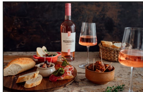
Freixenet Mederaño Rosado Mood 2