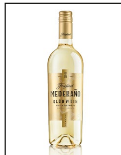
Freixenet Mederaño Glühwein weiß