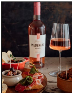
Freixenet Mederaño Rosado Mood 1