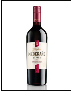
Freixenet Mederaño Tinto

Abdruck honorarfrei, Copyright: Henkell Freixenet