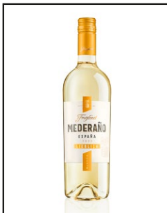
Freixenet Mederaño Blanco lieblich