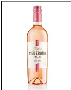
Freixenet Mederaño Rosado