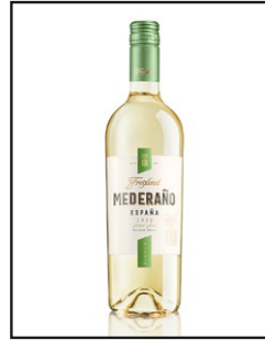
Freixenet Mederaño Blanco