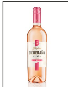
Freixenet Mederaño Rosado lieblich