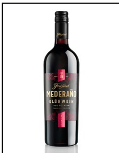
Freixenet Mederaño Glühwein rot