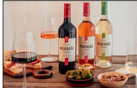
Freixenet Mederaño Mood 1