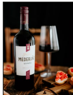
Freixenet Mederaño Tinto Mood 2