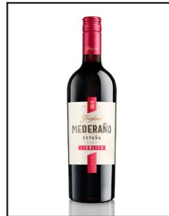
Freixenet Mederaño Tinto lieblich