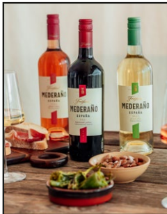
Freixenet Mederaño Mood 2