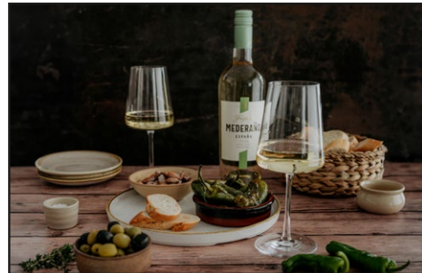
Freixenet Mederaño Blanco Mood