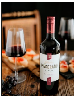
Freixenet Mederaño Tinto Mood 1